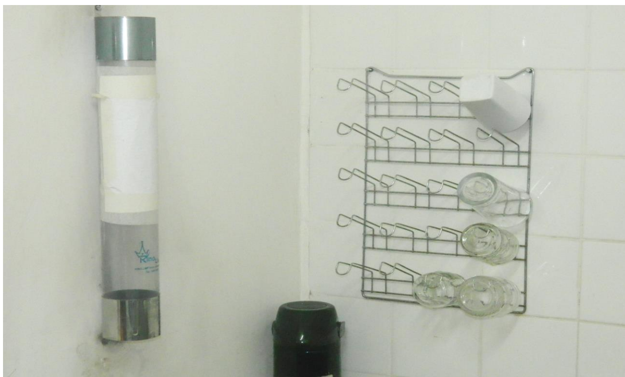
Foto 07 – falta de copos descartáveis, copos de vidro para varias pessoas.