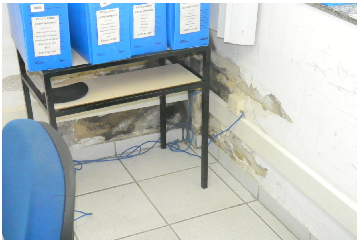
Foto 06 – grande infiltração no salão de atendimento de usuários.