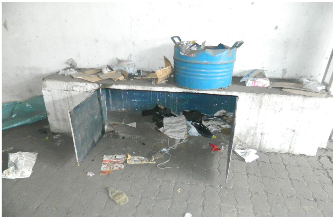
Foto 09 – muito lixo no galpão abandonado, proliferação de ratos e outros.