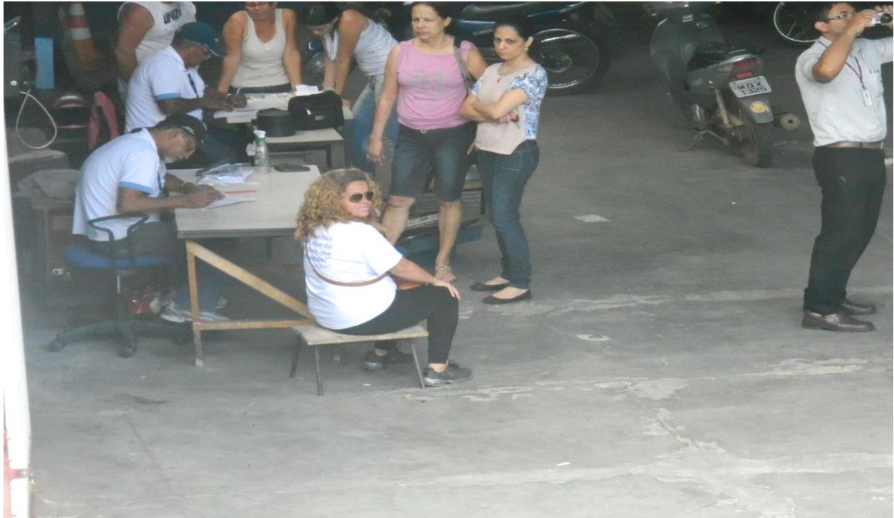
Foto 13 – usuários sem cadeira para sentar e servidores com cadeiras sem encosto.