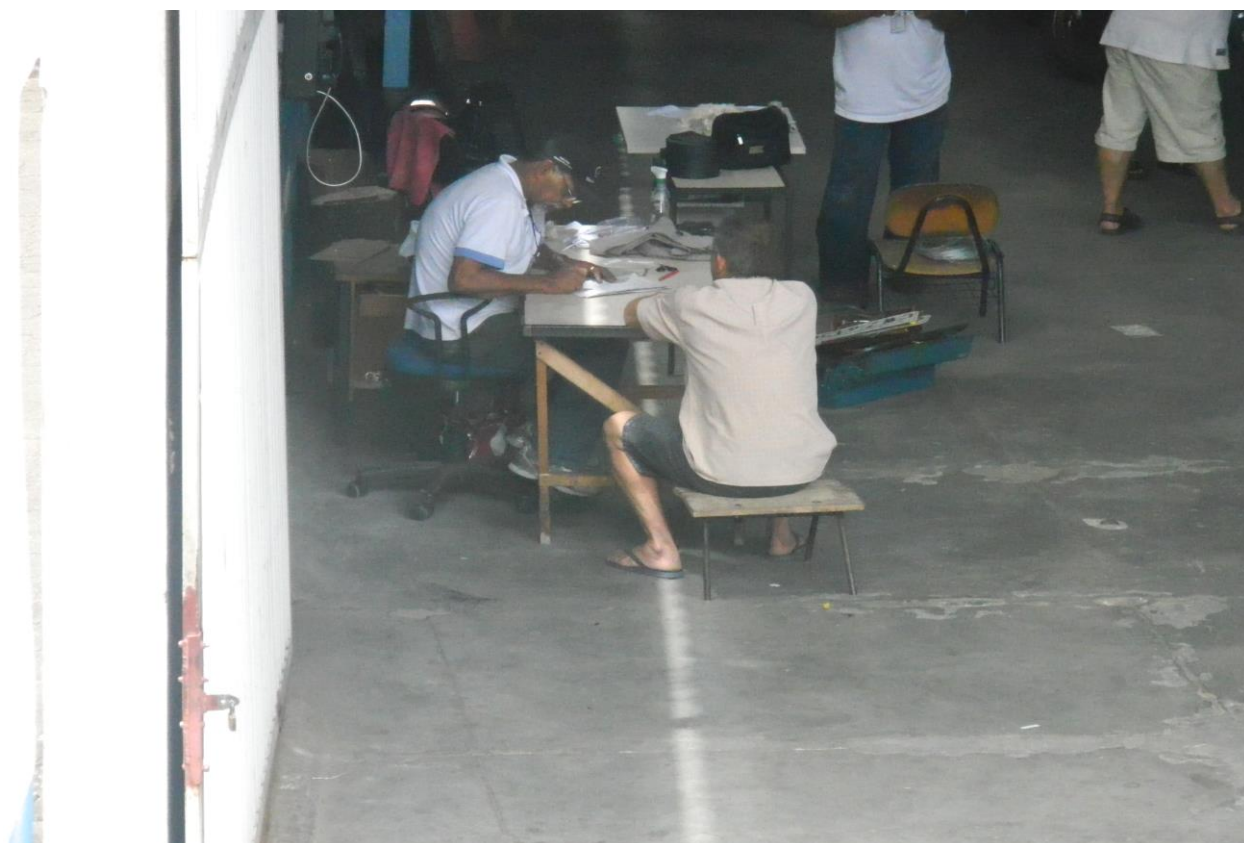
Foto 11 – falta de cadeira para servidor e usuário, no pátio de vistoria.

Fundado em 31 de janeiro de 1989 - Registro MT - DRT-ES 24.200.001 425/89 - CNPJ 32.478.356/0001-21