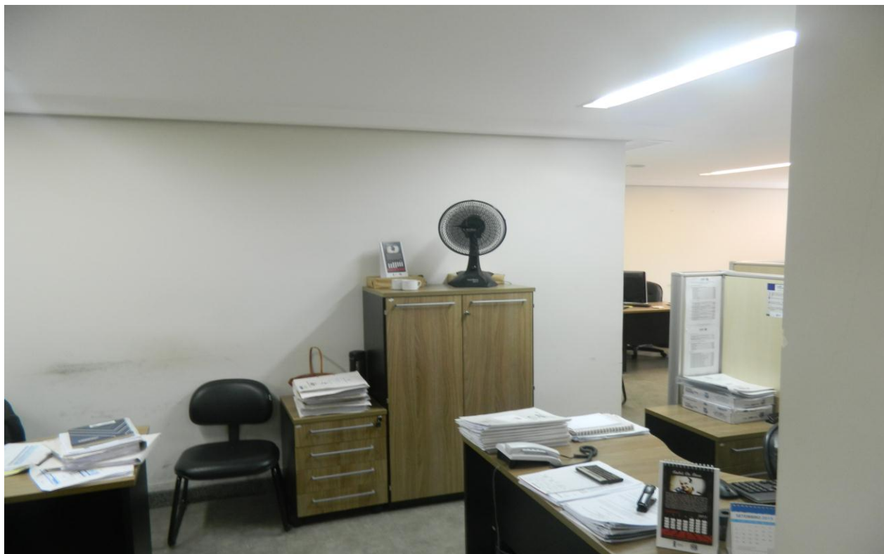
Foto 02- os servidores trazem de casa o próprio ventilador